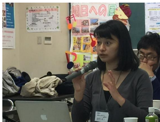
12月5日 東広島ワークショップ・見学会