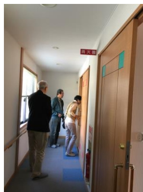
10月25日コミュニティハウス法隆寺見学会