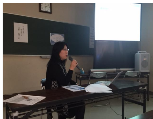
12月5日 東広島ワークショップ・見学会