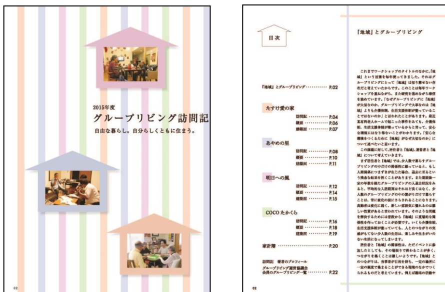
訪問記 表紙・目次

http://www.glnet-groupliving.org/files/uploads/2015houmon.pdf